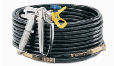
Kit de Mangueira e Pistola