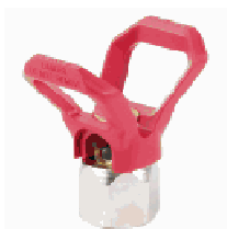
Suporte de Bico