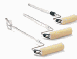
Rolo de Pintura Drenado